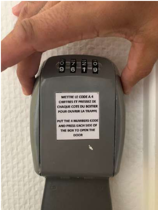
Mettez le code à 4 chiffres Put the code to 4 numbers