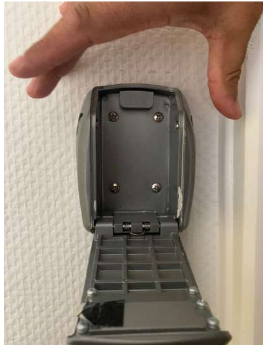
Pressez les boutons sur les côtés pour ouvrir la trappe. Récupérez les clés. Press the buttons on the sides to open the hatch. Pick up the keys.