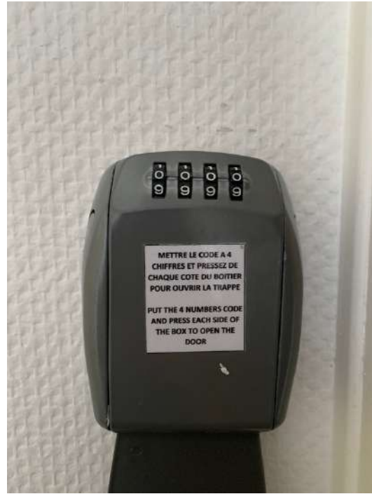
Descendez la trappe pour l'ouvrir Lower the hatch to open it