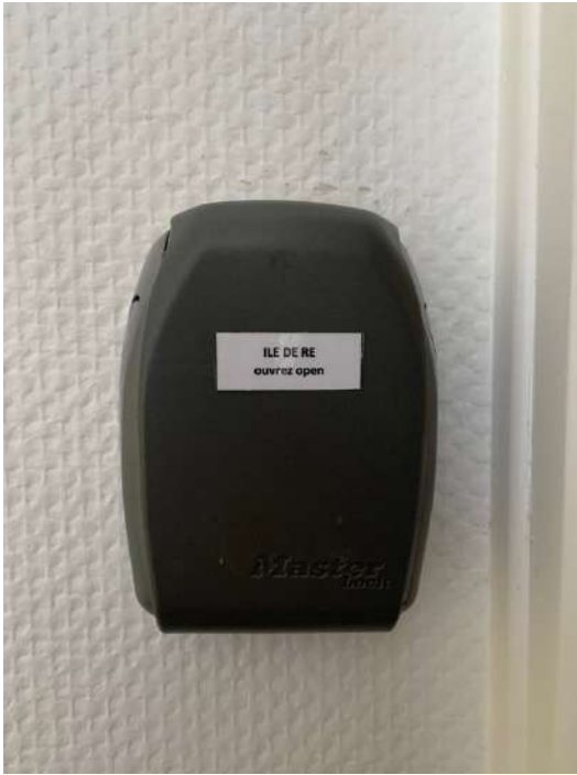
Boite à clés fermée Safety keybox closed